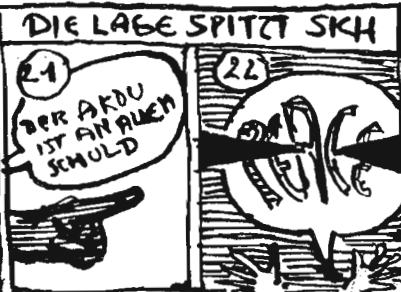
ZU IM GR. 'ORTMANN'